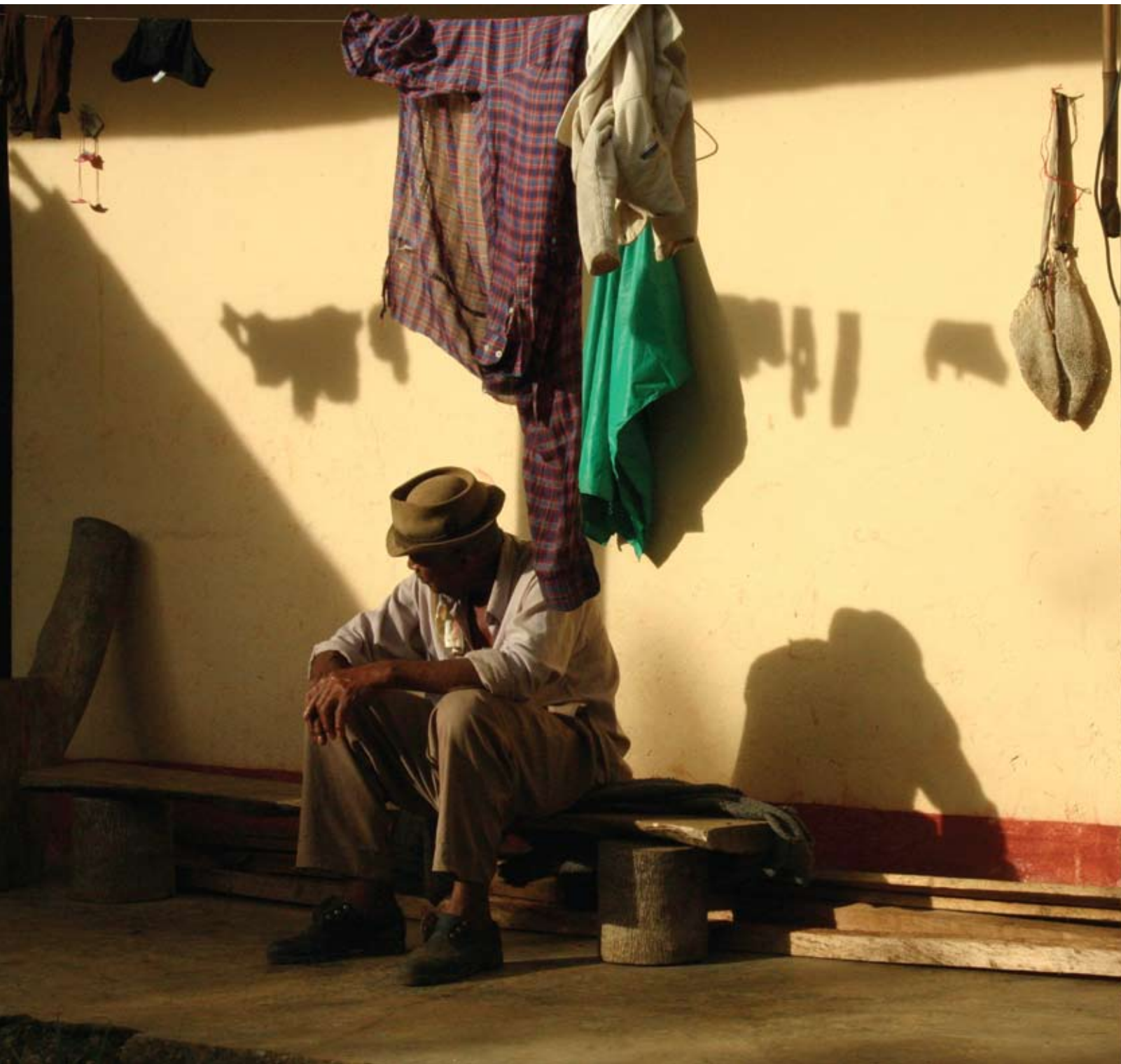
Foto: Axel Rojas, Agricultor luego de jornada de trabajo , Suarez, Cauca, 2006.