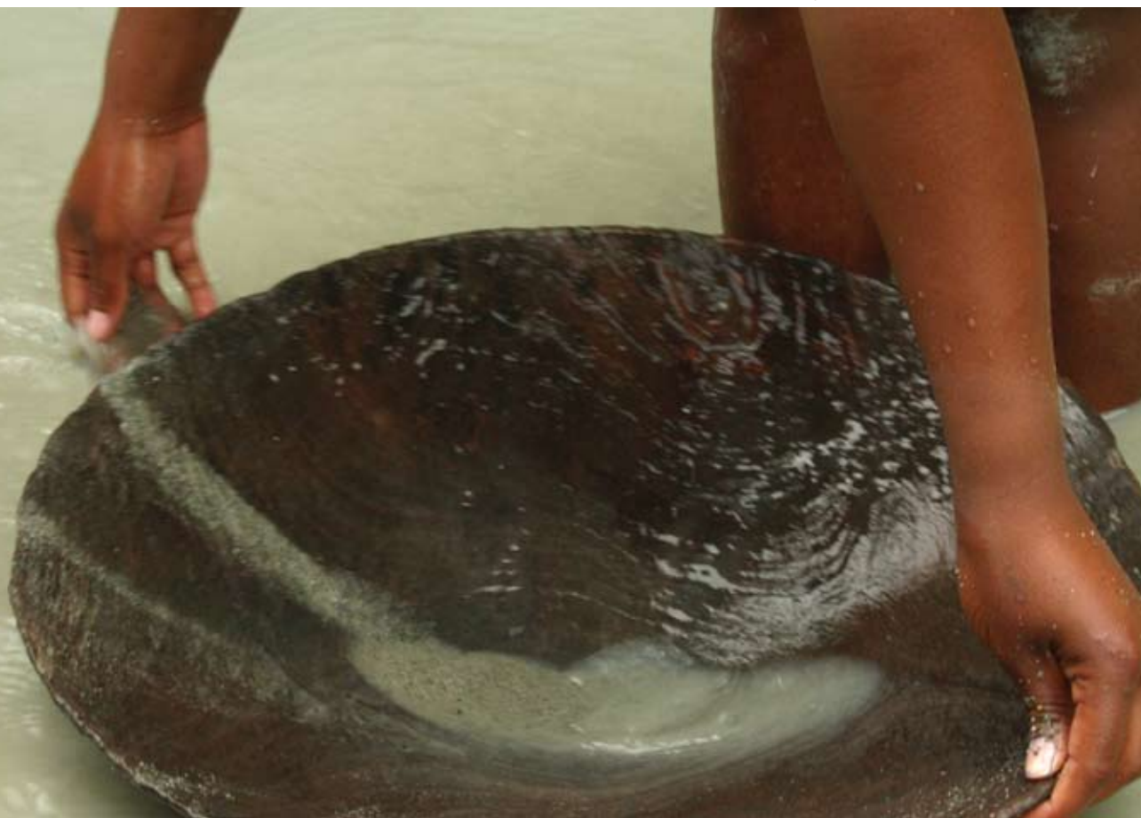
El mazamorreo del oro, Suarez, Cauca, 2006.

vistas de las organizaciones y académicos, principalmente, en el campo de la investigación de temas de cultura y política, así como la creciente articulación de expresiones artísticas a las luchas políticas; es el caso de la capoeira en Brasil, el reggae en el Caribe, la saya en Bolivia y las músicas del litoral Pacífico en Colombia, entre otras. En estos casos, la revitalización de expresiones artísticas como las músicas, bailes y artesanías contribuye a resignificar el valor de las expresiones culturales de los afrodescendientes. Este tipo de procesos ayuda a generar dinámicas de reconocimiento cultural básico (CCARC s.f.:12-14), en las que la acción política se orienta hacia la autoidentificación de las poblaciones negras, buscando superar los sentimientos de desarraigo cultural producto del racismo y las ideologías de mestizaje, al tiempo que se busca un reconocimiento formal por parte del Estado y sus instituciones (reconocimiento interno y reconocimiento externo).