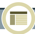
Cuadro XV.3 Disposiciones constitucionales y acciones legales relacionadas con la discriminación y las poblaciones afrodescendientes en América