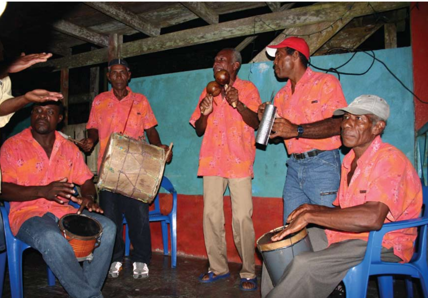
Músicos de Nuqui, Chocó, 2008.

Ahora bien, es importante insistir en que la sola presencia o peso porcentual de la población no es suficiente para comprender las condiciones de vida actuales de los afrodescendientes en una sociedad. Los sistemas políticos y los marcos jurídicos nacionales, las formas de organización política de los