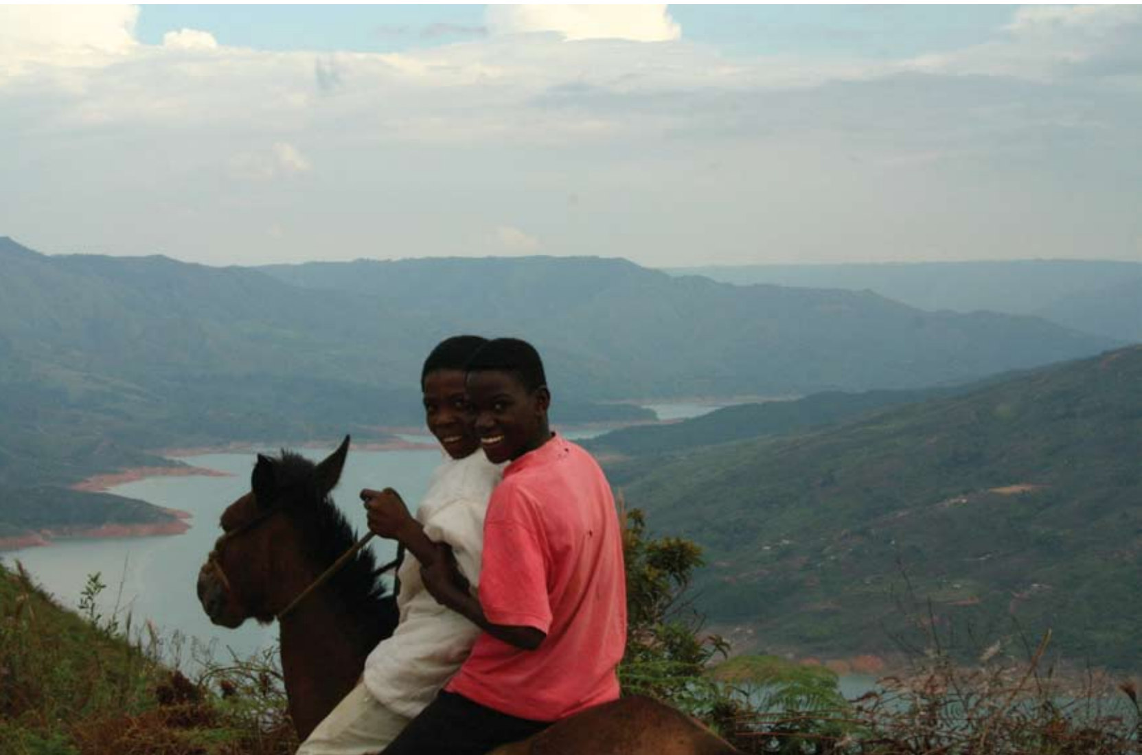
Jóvenes a caballo, Suarez, Cauca, 2006.

Un caso emblemático de esta forma de resistencia lo encontramos en Colombia, en uno de los palenques más significativos de la región: el de San Basilio, primer lugar reconocido libre por la Corona española en América Latina. El Palenque de San Basilio fue reciente-